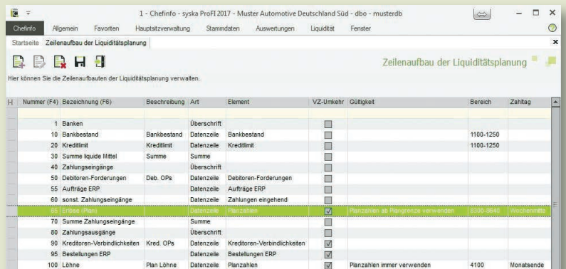
Individueller Zeilenaufbau des Reports

Um eine Liquiditätsprognose für die Zukunft zu erstellen, können Sie die Planzahlen aus der syska ProFI Chefinformation mit einbeziehen. Der Aufbau der Auswertung kann individuell gegliedert und komfortabel als Report aufgerufen werden.